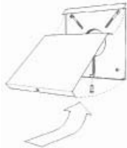
Pohja- ja kansikappaleiden yhdistäminen alareunassa olevalla