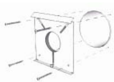
Pohjakappaleen kiinnitys ruuveilla